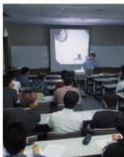
▲セミナールームでは、OHP、液晶プロジェクター、ビデオデッキ、カセットデッキなどの設備が利用できる。

湖畔から徒歩十分あまり、周辺の静かな森の中にしっくりと調和した瀟洒なエントランスをくぐると、広々とした玄関ロビー。高い窓からは、美しい森の緑と太陽の光がふんだんに注ぎ込みます。研修棟の二階、三階には、